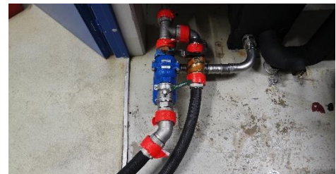
Abbildung 4: Adapteranschlüsse für Luft- und Wasserversorgung