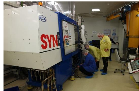
Abbildung 2: Vorbereitungsarbeiten an den Spritzgiessmaschinen