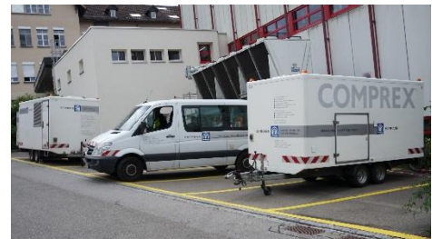
Abbildung 3: Comprex®-Technik vor Ort