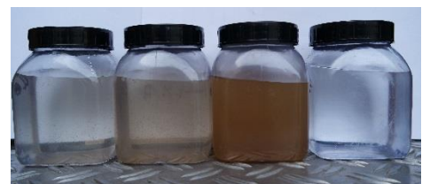
Abbildung 5: Trübung des Spülwassers im Verlauf der Reinigung