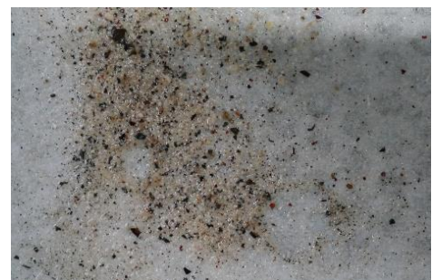
Abbildung 4: Feststoffaustrag von Partikeln während der Reinigung