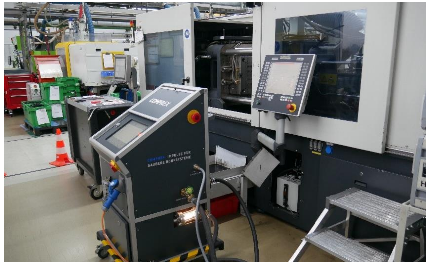
Abbildung 1: MCU-20 im Einsatz vor Ort