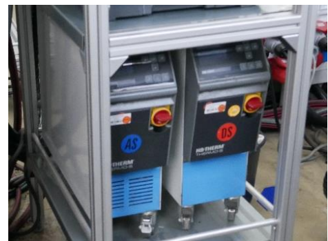
Abbildung 3: Temperiergeräte vor Ort