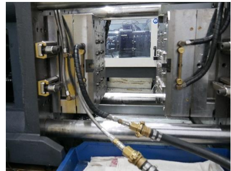
Abbildung 2: Zugang zum Werkzeug über standardisierte Adapteranschlüsse