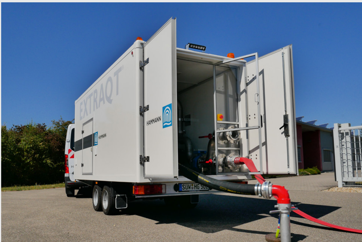
Bild 1: Einheiten für die Zustandsbewertung und Reinigung von Rohrleitungen

Die Hammann GmbH möchte sich den neuen Aufgaben stellen und richtet ihre Aktivitäten im kommunalen Bereich darauf aus. Die beiden praktizierten Spülverfahren ergänzen sich in idealer Weise ( Bild 1 ). Die Wasser-Saug-Spülung ermöglicht neben der Spülung selbst auch die Zustandsbewertung von Rohrleitungsabschnitten in der Trinkwasserverteilung. Kritische Netzbereiche lassen sich mittels Hot-Spot-Analyse identifizieren und anschließend mit dem Impulsspülverfahren gründlich reinigen. Bezüglich der präventiven Netzpflege sind die beiden Spülverfahren mit ihren unterschiedlichen