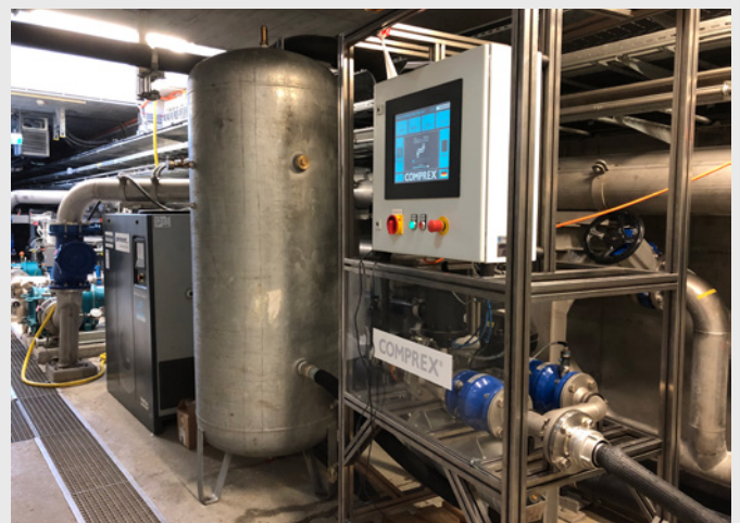
Bild 3: Ablagerungen in Schlammlleitung einer Kläranlage und stationäre Complex-Anlage